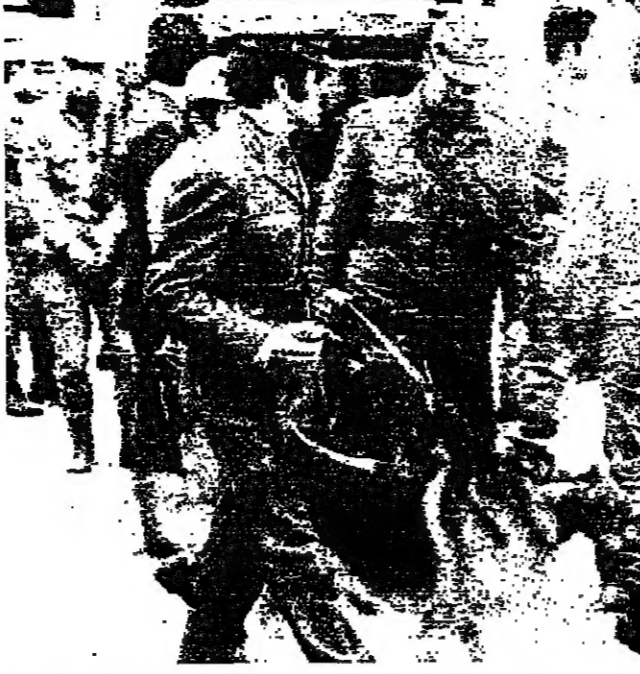
أحد الكلاب البوليسية التي استخدمت في البحث عن المطلوبين بالأسواق الداخلية في طرابلس أمس